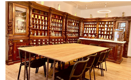
Konferencija Broj sjedišta 9-10