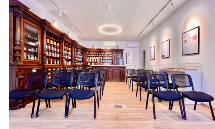
Teatar Broj sjedišta: 20-24