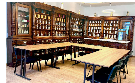
U-postavka Broj sjedišta: 10